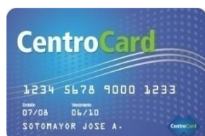
CENTRO CARD S.A. como Fiduciante y Administrador